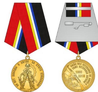
Медаль «30 лет победы в битве за Кuito Куанавале»