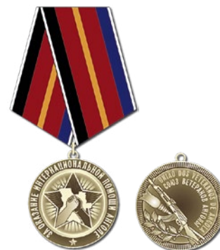
Медаль «За оказание интернациональной помощи Анголе»

ние политической и экономической независимости Анголы в XX веке. Она вручается всем членам Союза, российским ветеранам Анголы, а также гражданам ближнего зарубежья и кубинским интернационалистам, выполнявшим свой интернациональный долг в этой стране в 70–90-х годах XX в. Только за последние несколько лет эта медаль вручена нескольким сотням российских и зарубежных ветеранов Анголы.