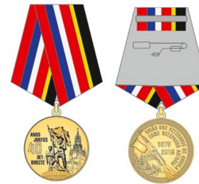
Медаль «40 лет вместе: 1975–2015»