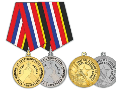
Медаль (двухстепенная) «За сотрудничество: Россия – Ангола»